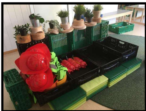
BARNA HAR LAGA SIN EGEN BRANNBIL, KLAR TIL UTRYKNING.