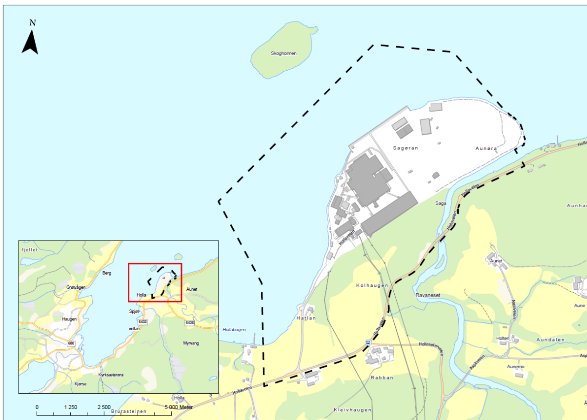
Figur 1: Planavgrensing

Tiltakene i planen er nærmere beskrevet i kap. 3 i planprogrammet. Optimalisering av tiltakene og analyse av konsekvenser og avbøtende tiltak vil være en del av planprosessen.