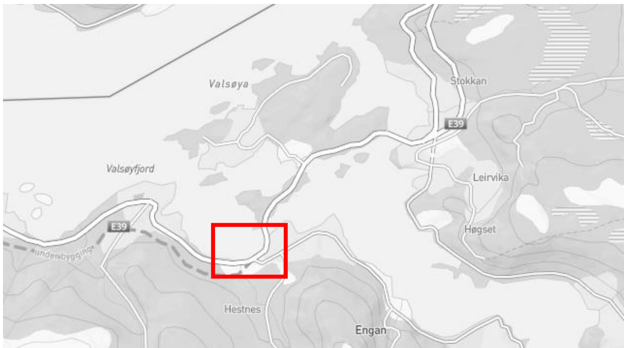
Figur 1: Lokalisering av område berørt av reguleringsendringen.

Heim kommune har mottatt søknad om mindre reguleringsendring av reguleringsplan for E39 Otneselva – Hestnes, vedtatt 06.11.2014. Endringen innebærer utvidet areal for motfylling til ny E39 og at areal avsatt til «Bruk og vern av sjø og vassdrag» blir endret til «LNF-formål», ved Hestnes. Bestemmelsene skal ikke endres.